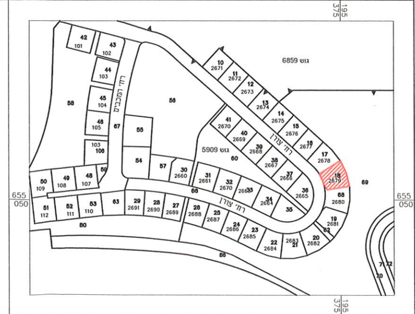
תרשים סביבה קנ"מ 1:2500

ועדה מקומית שהם אישור תכנית מס 421-1060425 הועדה המקומית החליטה לאשר את התכנית ביום 20.9.22 מס' 20220009 מהנדס הוועדה ירד הגעיה