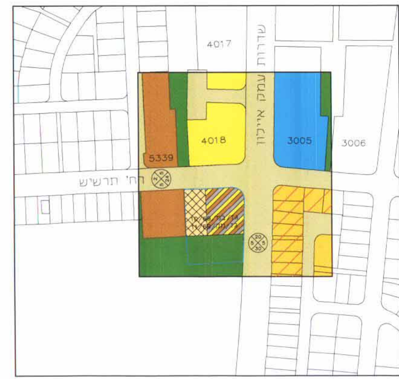
תרשים סביבה קני"מ 1:2500