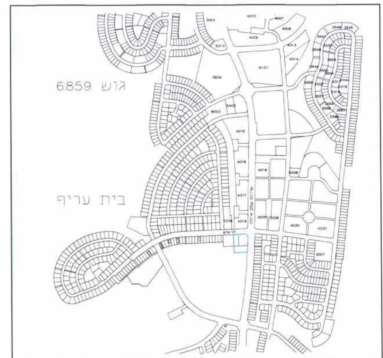
תרשים התמצאות כללית קני"מ 1:10000