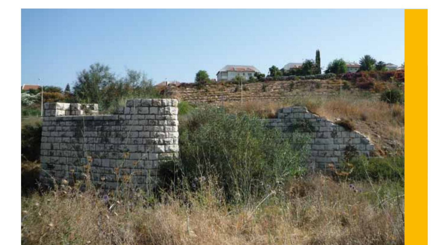
גשר נחל עריף