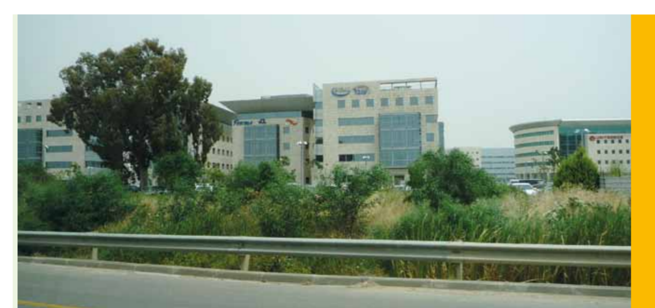
עץ אקליפטוס ששרד בהקמת אייר-פורט סיטי, לידו היה מתקן שינוע דלק מטוסים למכליות של שדה התעופה